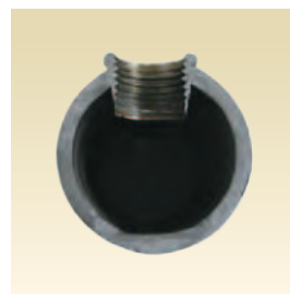
フロードリルネジ断面写真