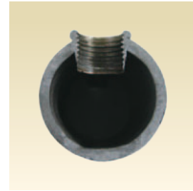
フロードリルネジ断面写真